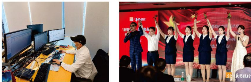
面对疫情，华润银行人迎难而上、主动出击