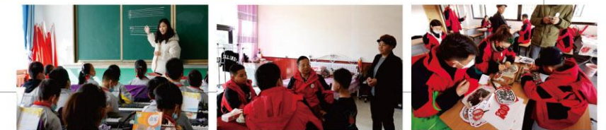
多年来，系统开展快乐助学“135助学模式”