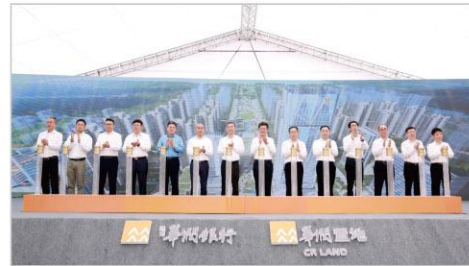
2021年8月，新大楼项目开工仪式