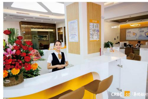
2019年智能网点升级至2.0版