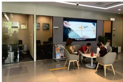
2018年深圳分行营业部落地首家智能网点