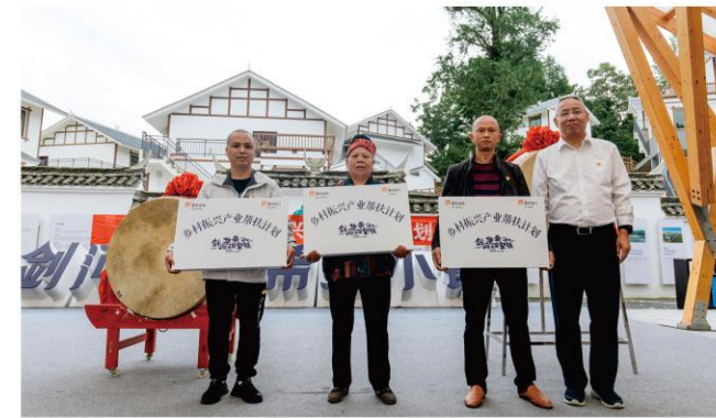
向剑河华润希望小镇投入30万公益基金，帮扶村民民宿创业

此外，也通过支持乡村公益、开展防疫志愿服务、消费扶贫等多元化方式，为乡村振兴贡献力量。