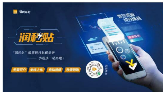
推出“润秒贴”产品，解决中小微企业贴现问题