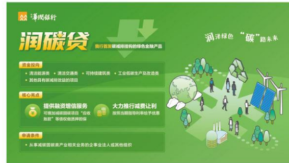
落地首个助力减碳固碳绿色金融产品“润碳贷”