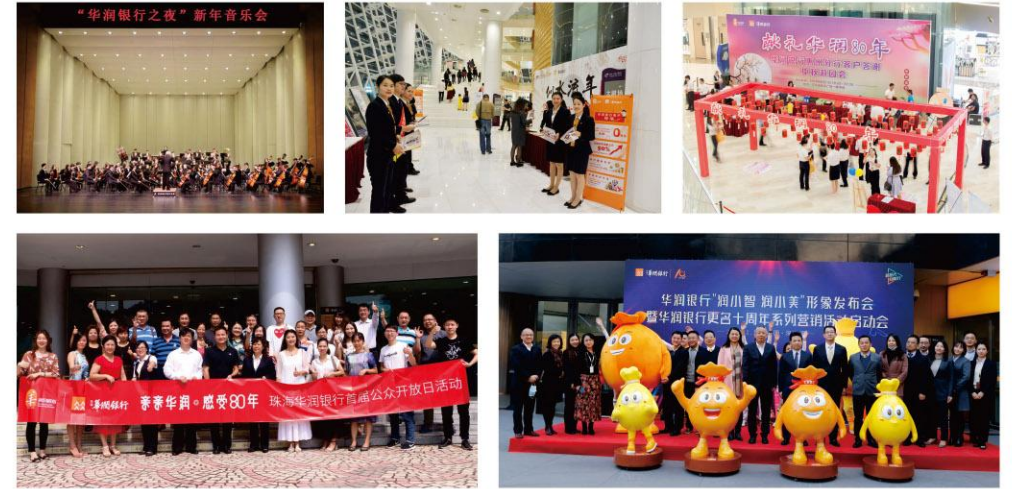
开展形式多样的客户回馈、主题营销活动

已各类主题客户回馈、营销活动为抓手，打造具有华润银行特色的增值服务体系，如“华润银行之夜”系列、公众开放日、“华润80年联合营销”“更名十周年联合营销”等，利用重要时点，匹配优质产品开展营销，提升对我行品牌认知与认同的同时，进一步提升客户回馈活动质效。