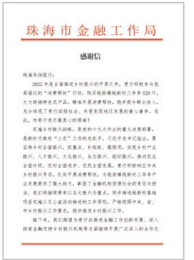
支持“三农”消费帮扶，受到珠海市金融局的肯定