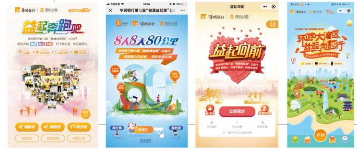
线上+线上“健康益起跑”，已成长为我行的一张靓丽的名片