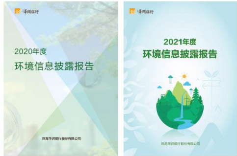
作为湾区首批对外发布环境信披报告的银行，已连续2年发布《珠海华润银行环境信息披露报告》