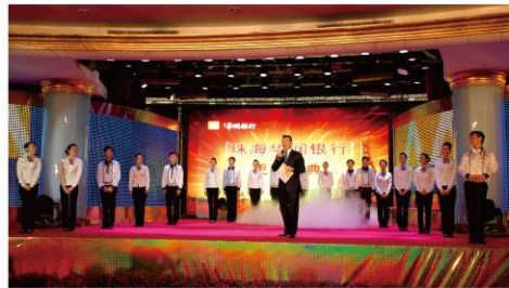
2011年4月15日，我行举办更名庆典