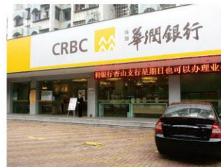
携手太平洋咖啡打造“店中店”，开办夜市银行、周末银行